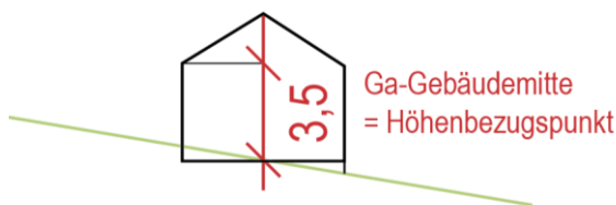
schematische Darstellung zur Verdeutlichung der Festsetzung zu Garagen

Abweichend von Art. 6 der BayBO und der Abstandsregelung der Gemeinde sind in den Abstandsflächen sowie ohne eigene Abstandsflächen, auch wenn sie nicht an der Grundstücksgrenze errichtet werden, Garagen einschließlich ihrer Nebenräume mit einer mittleren Wandhöhe bis zu 3,5 m zulässig (Art. 6 Abs. 1 Satz 4 BayBO).